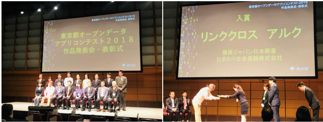
東京都データアプリコンテスト2018 授賞式の様子